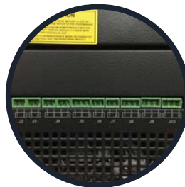
Contactos secos. (del J2 al J10)