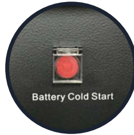
Battery Cold Start