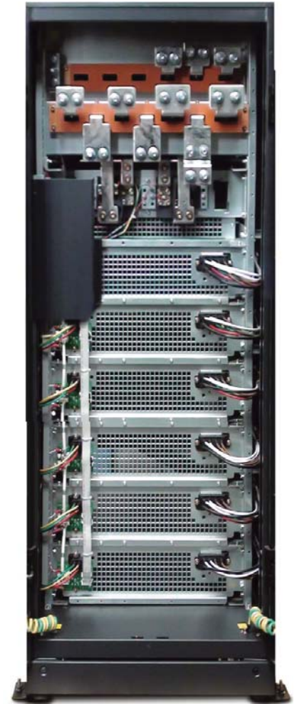
Equipo completo (vista trasera)