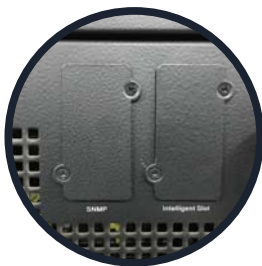
SNMP e Interfaz de la tarjeta inteligente