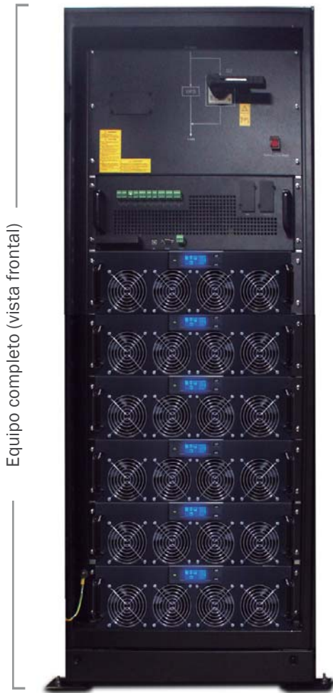
Equipo completo (vista frontal)