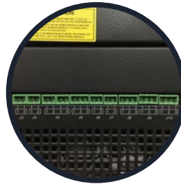
Contactos secos. (del J2 al J10)