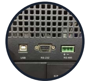
Conectores USB RS-232 -RS-4