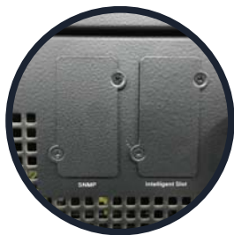
SNMP e Interfaz de la tarjeta inteligente