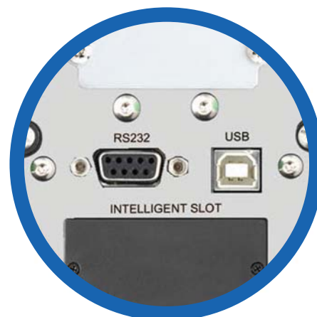
Puertos de comunicación