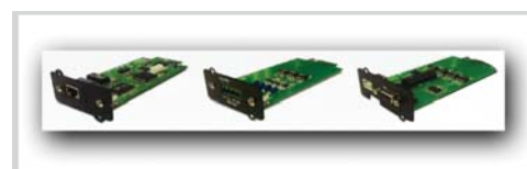
Tarjetas opcionales SNMP y de control