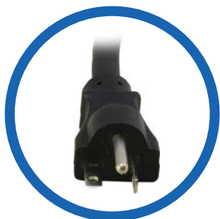
Cable de alimentación CA NEMA 5-20P