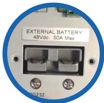
Entrada banco de baterías externas