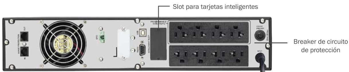
Vista trasera del equipo