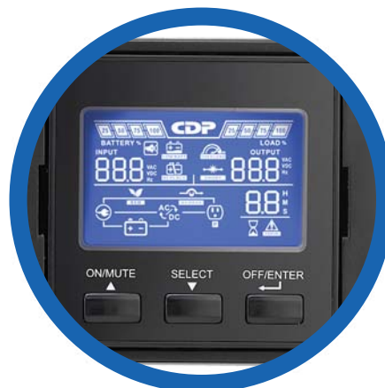
Panel LCD con rotación de 90°